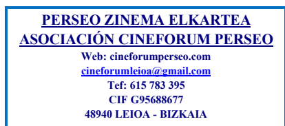
Fdo. Eva Vázquez Por la Asociación Cineforum Perseo